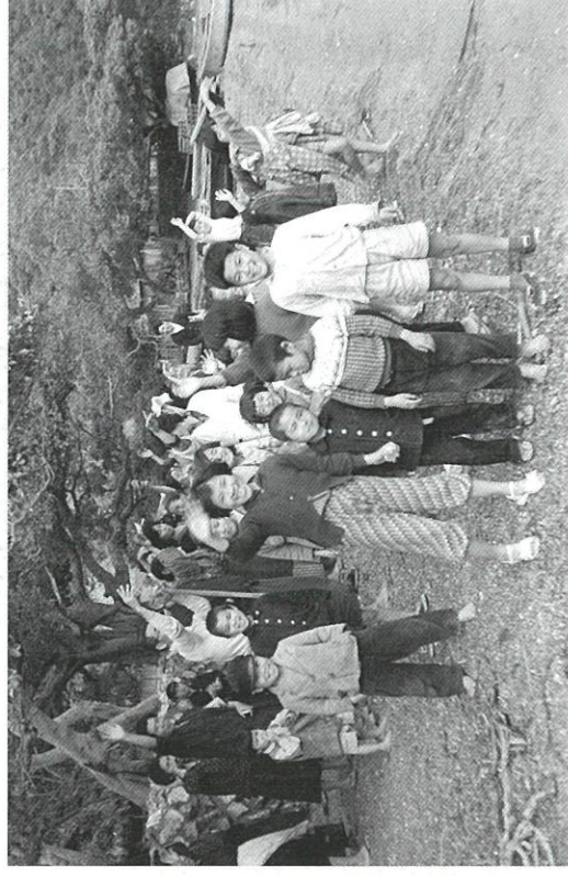
船を見送る子どもたち

1940年、オーストリア生まれ。1961～1963年、東京大学東洋文化研究所(文部省交換留学生)。ウィーン大学主任教授、ボン大学主任教授、法政大学特任教授等を経て、現在、ボン大学名誉教授、東京国立博物館客員研究員、法政大学国際日本学研究所客員所員。著書に『世界の沖縄学—沖縄研究50年の歩み』(芙蓉書房出版)、『南西諸島の神観念』(住谷一彦との共著、未來社)、『日本民族学の戦前と戦後—岡正雄と民族学の草分け』(編著、東京堂出版)など多数。