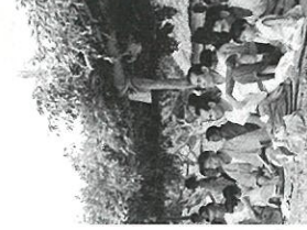
十五夜豊年祭の観客