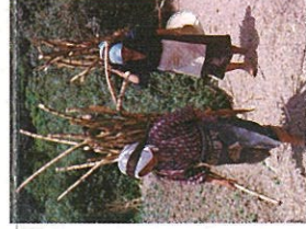
サトウキビを運ぶ